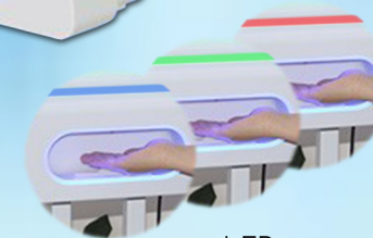
LED Indicateur de niveau