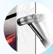
3mm vitre trempée