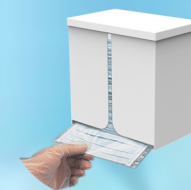
Distributeur de Masque (Option sur le pied)