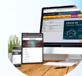
Administration à distance du contenu + Info -> Niveau gel